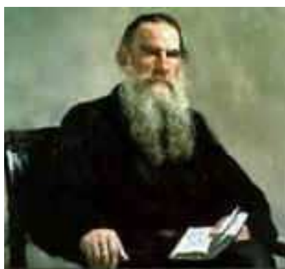
Lev Tolsztoj (1828-1910)