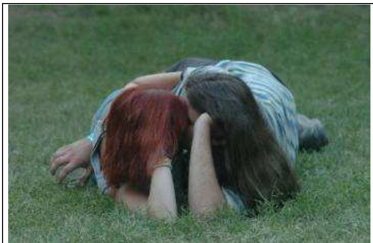
Függés a másiktól. Hagyományos szerepek, mai elvárások

A társfüggőség egyik legfontosabb jellemzője, hogy az érintett mindig másokra figyel, sosem magára, a mások szükségleteinek kielégítését tartja szem előtt, míg a sajátjait elhanyagolja. A kodependens ember folyamatosan retteg attól, hogy a számára fontos személy elhagyja, ezért partnere bármilyen negatív következményekkel járó viselkedését - például szenvedélybetegségét - tolerálja. Miközben túlzott felelősséget érez másokkal kapcsolatban, a saját érzéseiről tudomást sem vesz - ez a magyarázat interjúalanyunk viselkedésére is.